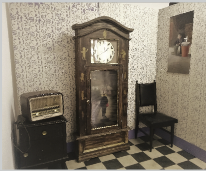
LUCERO ESCRIBA DE LA CRUZ TESTIGO DEL TIEMPO Instalación pictórica 200 x 200 cm