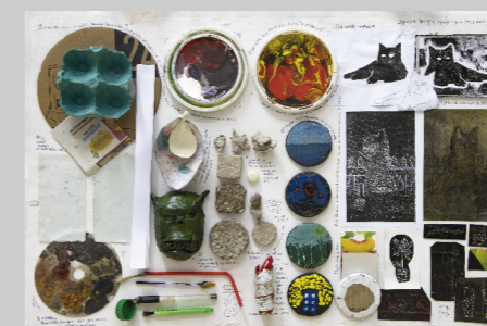
ANGELO FUERTES REVILLA RECOPILOCACIÓN Collage 46 x 70 cm