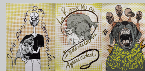
SUSAN LEÓN VILLAGÓMEZ CRIANZA Impresión digital 150 x 70 cm