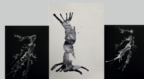
NICOLAS HUAMANI JUJO CONCIENCIA Y METAREPRESENTACIONES Gelatina de plata / Impresión digital 50 x 80 cm