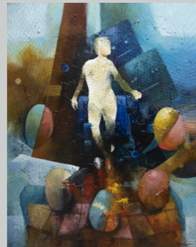
BARDI TARQUI POLOSI NACIMIENTO DE PARIACACA Óleo sobre lienzo 150 x 120 cm