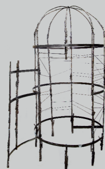
KARLA SERRANO CAVIEDES DONDE EL CUERPO HABITA Soldadura 220 x 117 cm