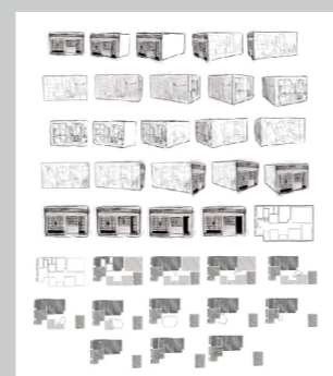
ANGELA PAREDES DELGADO LA CASA Y SU CARTOGRAFÍA Grabado 160 x 158 cm