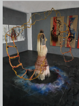
KARINA JIMENEZ GOMEZ TEJIENDO EL PODER Pintura expandida 400 x 400 x 500 cm