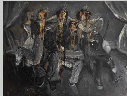
BRUNO PASTOR VELASCO AMISTAD Óleo sobre lienzo 100 x 120 cm