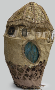
FIORELLA FLORES MORA (FITO COKY) MATRICES DE LA MEMORIA Grabado expandido 120 x 80 x 80 cm