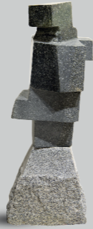
NANCY ADRIANZEN MEZA CADENCIA Labra en granito natural 76 x 26 x 26 cm