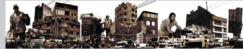
SANDRA GALLEGOS MEZA (DE) CONSTRUCCIÓN - PARTE II Impresión digital 500 x 90 cm