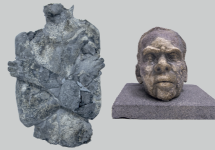
PATRICIA MOYER LUDEÑA DE PIEDRA NO SOY Piedra y resina Variables