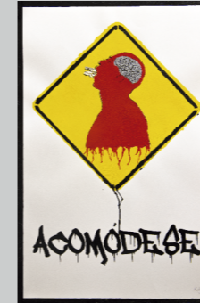
BRYAN ALVA RAMOS (KUROU) ACOMÓDESE Serigrafía, estencil y acrílico sobre cartulina 67.7 x 44.5 cm