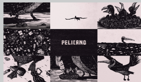
HANS BALDOCEDA VERA PELICANO Grabado expandido Variable