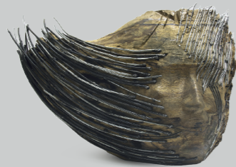
HENRY CARDOSO BLAS GESTO TRANSITORIO Madera y metal 80 x 50 x 20 cm