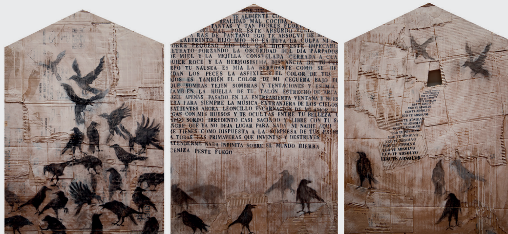
MILUSKA DUEÑAS VERA LA CASA