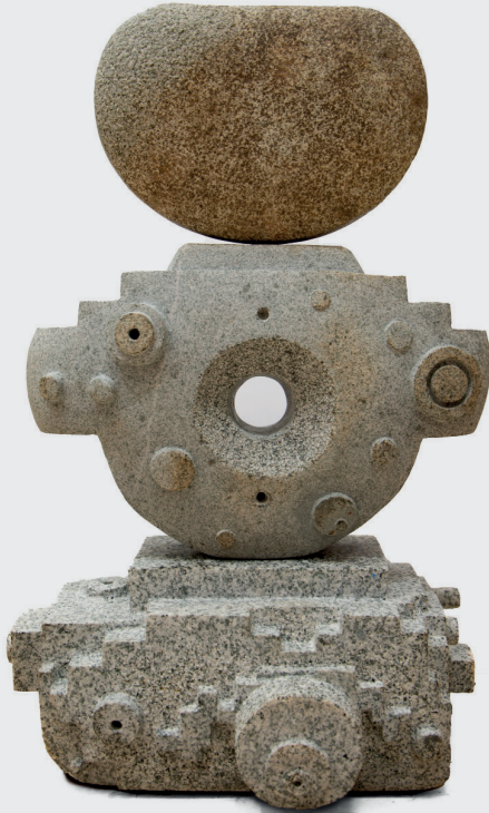
PABLO YACTAYO CHUMPITAZ BATÁN ANCESTRO CONTEMPORÁNEO

Labra sobre granito natural 60 x 40 x 22 cm