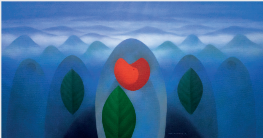
DANIEL MANTA ÁNGELES DE LA SERIE “DE LA MONTAÑA AZUL” Óleo sobre lienzo 200 x 105 cm