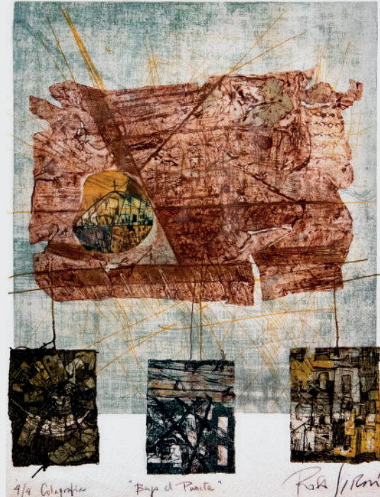
ROSA GIRÓN VARGAS BAJO EL PUENTE Colografía 65 x 45 cm