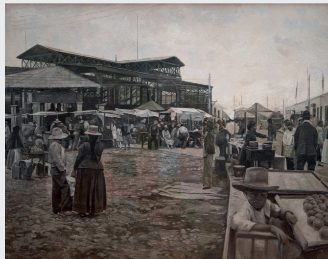
CÉSAR FERNÁNDEZ MENDOZA UN DÍA DE VIENTOS, MERCADO DE ABASTOS DE HUARAL - 1960 Óleo sobre lienzo 118 x 149 cm