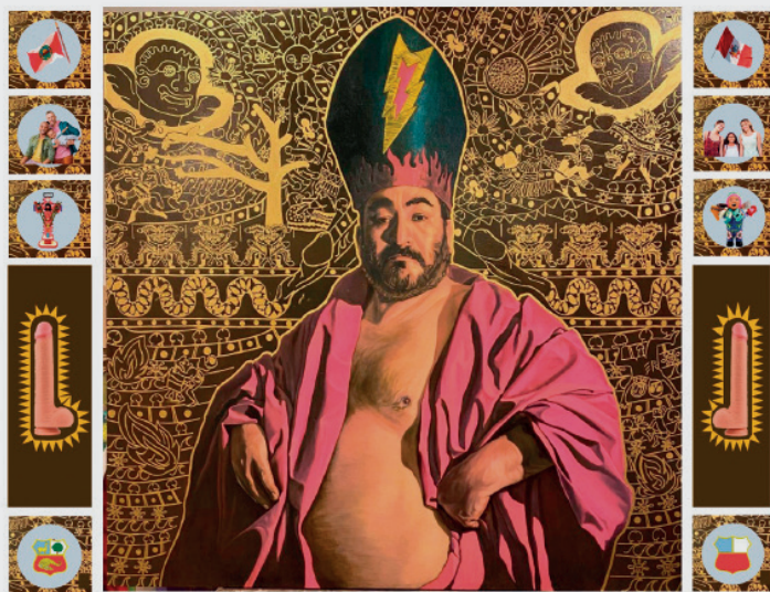
MARIO MOGROVEJO DOMÍNGUEZ EXCESOS ABYECTOS Óleo sobre lienzo 130 x 170 cm