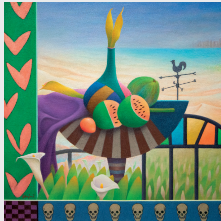
ANTONIO CARO REMIGIO ISLA BONITA Óleo sobre lienzo 100 x 100 cm