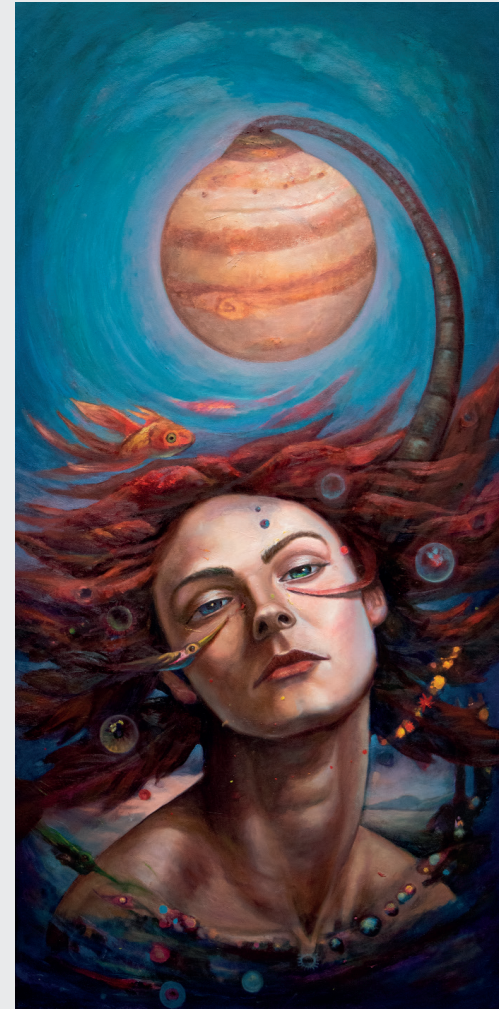
JOSÉ LOAYZA MORALES GÉNESIS Óleo sobre lienzo 119 x 59 cm