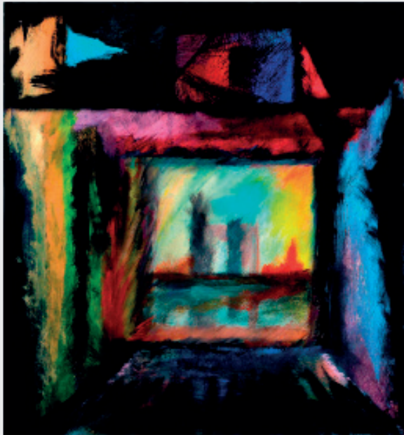
JUSTO ESTRELLA ORIHUELA INTERIOR Técnica mixta 60 x 50 cm