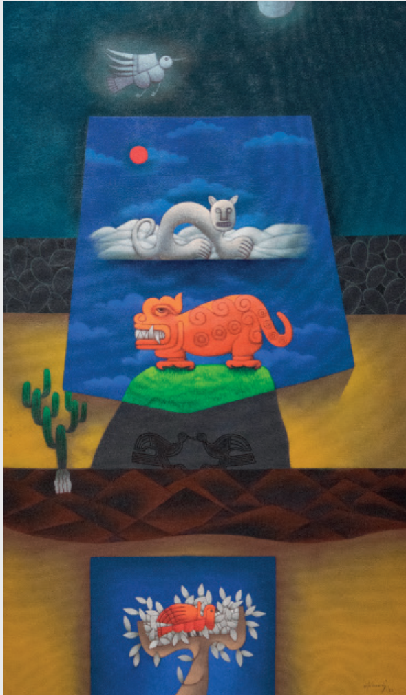
JOSÉ ALDANA SULLÓN DE LA SERIE “FAUNA ANCESTRAL” Óleo sobre lienzo 122 x 67 cm