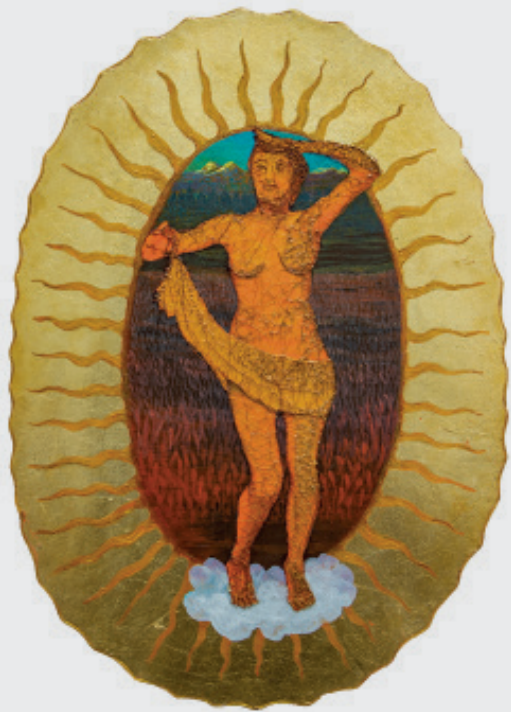
SILVIA BUENO ROLLER DESDE LOS ANDES