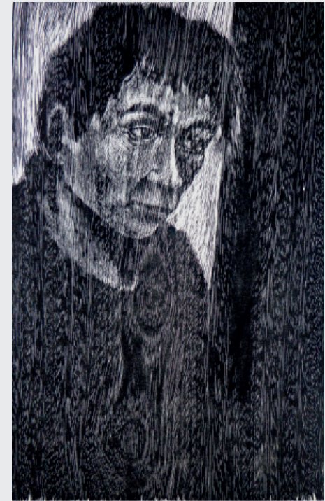
JOSÉ CHERO CHERO S/T Xilografía 69 x 49 cm