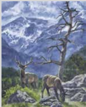
- - -