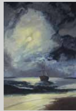
PIERO VERA FLORES PAISAJE NOCTURNO MARINO - 29,7 x 42 cm