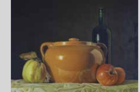
VICTOR ALZAMORA ZAMBRANO