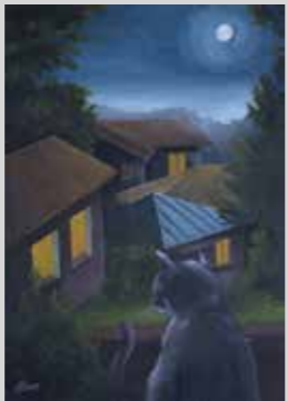
ELIANE ORTEGA CHUQUILLANQUI 4:00 AM Acrílico 29,7 x 42 cm