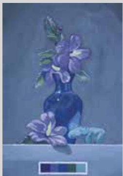
LADY JUANA ESPINOZA - - -