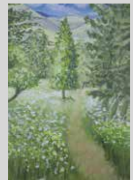
ANDREA ZEGARRA BARRENECHEA ESTUDIO DE BOSQUE Témpera 28 x 40 cm