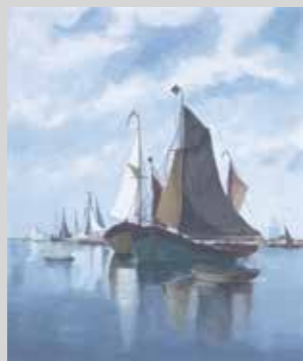
DAFNE NICOL INGA BARRIOS - - -