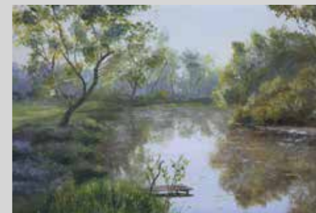
JANET SENCA RIOS ESTUDIO PAISAJE CAMPESTRE Gouche 29,7 x 42 cm