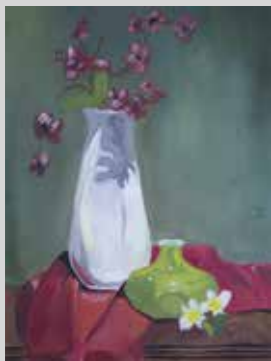
LEONARDO FLORES QUISPE - - -