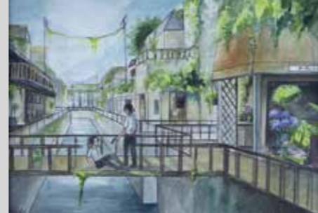
HASTA EL ÚLTIMO SER VIVO Acuarela y lápices de colores 29,7 x 42 cm