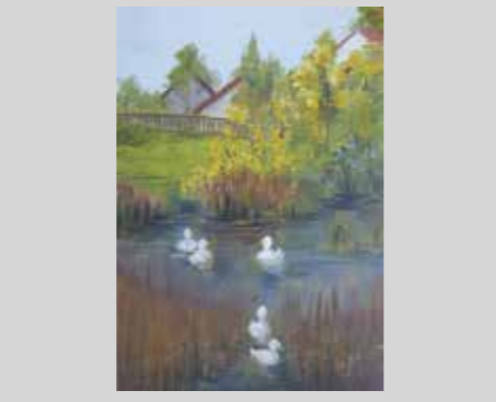
SAMARA REQUEJO PÉREZ PATOS EN LA LAGUNA Témpera 29,7 x 42 cm