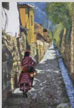
SAYRA UECHI PAISAJE ANDINO