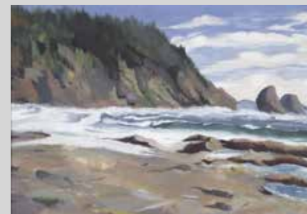
AUDREY ZEVALLOS MINAYA ESTUDIO DE "MATT SCOTT" Témpera 29,7 x 42 cm