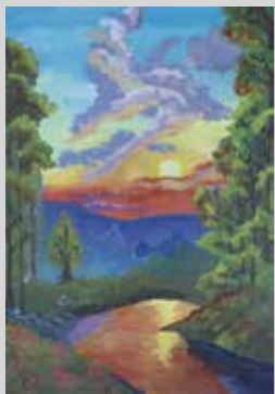
NICOLAY RODRIGUEZ ALVARADO ARMONIA EN PERSPECTIVA Témpera 29,7 x 42 cm