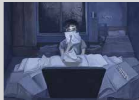
¿ESTO ES VIDA? Acuarela 29,7 x 42 cm