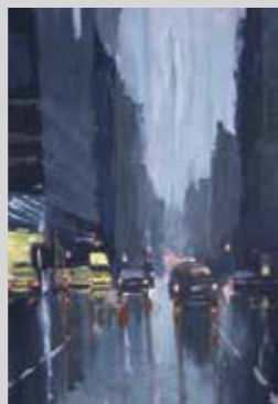
VASCO ZAGACETA ESTUDIO DE PAISAJE NOCTURNO Témpera 29,7 x 42 cm