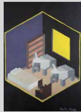
ANDRÉ LÓPEZ SENITAGOYA TANATOLOGÍA Acrílico sobre cartulina 29,7 x 42 cm