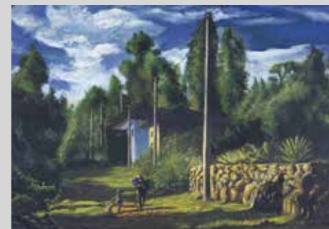
FRANK VEGA INOCENCIA, 2023 Tempera himi y goma arábica 30 x 40 cm