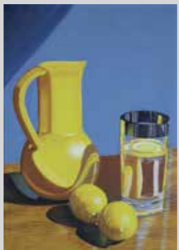
YANIRA JAUREGUI - - -