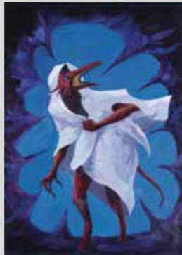
GABRIEL MENDOZA PÁNICO - 29,7 x 42 cm