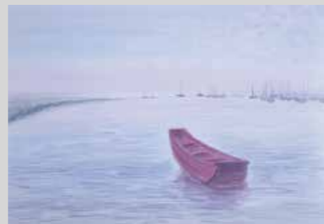
GRECIA OCHOA TORRES BARQUITO SOLITARIO Acuarela y lápices de colores 29,7 x 42 cm