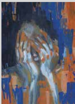
SILVANA MUCHA CORDOVA DESISTIR Témpera 36,5 x 27 cm