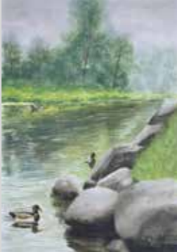
LOS PATITOS Acuarela 42 x 29 cm