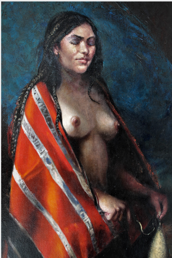
MAURO YRIGOYEN FAJARDO LA HILANDERA Óleo sobre lienzo 118 x 90 cm