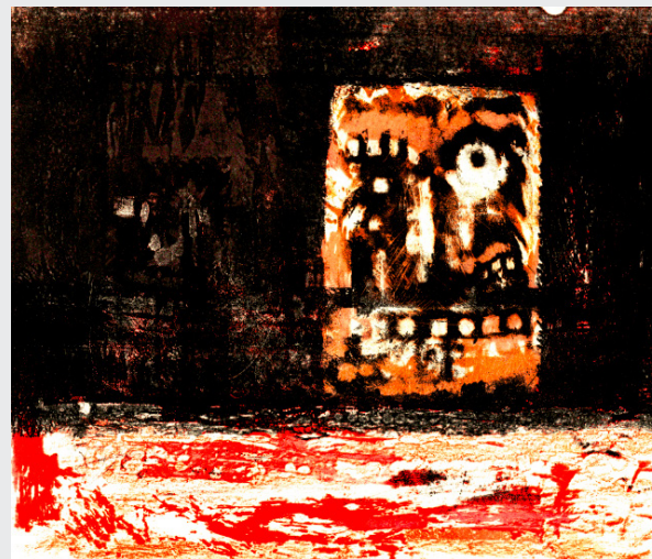
JUSTO ESTRELLA LAGRIMÓN Técnica mixta 56 x 65 cm