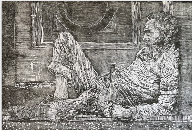
CÉSAR URBINA FRÍA NOCHE Xilografía 65 x 95 cm