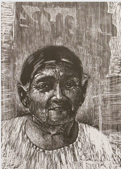
JOSÉ CHERO S/T Xilografía 46,5 x 33,5 cm