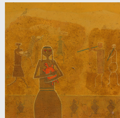
WILBERT PISCOYA S. S/T Técnica mixta / 50 x 50 cm