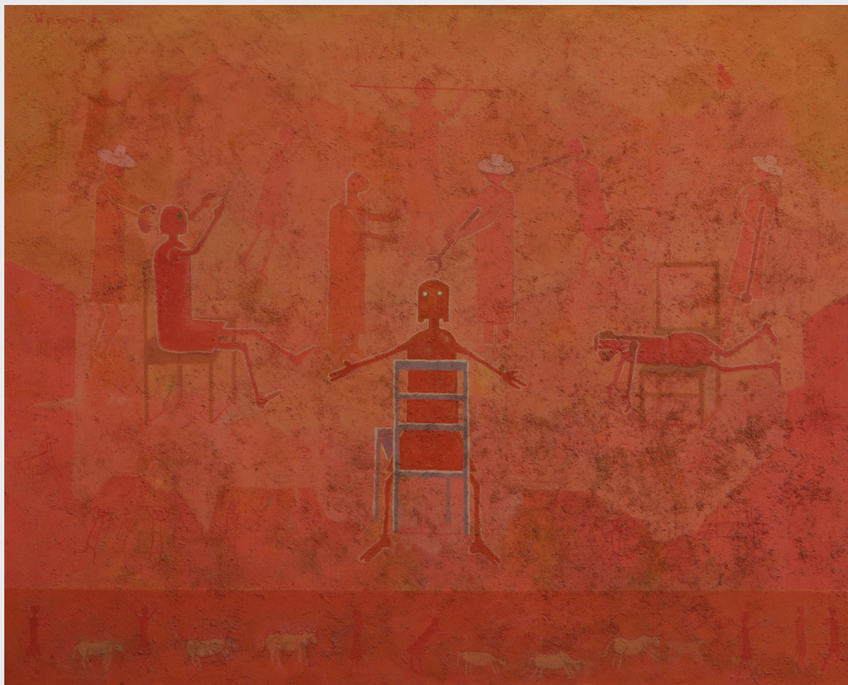
WILBERT PISCOYA S. S/T Técnica mixta / 130 x 150 cm