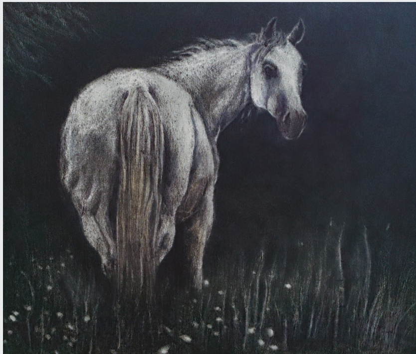
ROSA GIRÓN EJERCICIO A PATIR DE PLANCHA DE FIERRO OXIDADO Técnica mixta 34 x 40 cm