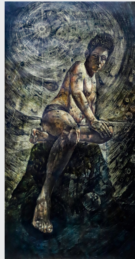
JOSÉ LUIS LOAYZA MORALES EPIFANÍA Técnica mixta 120 x 80 cm