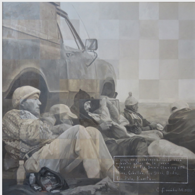
CÉSAR N. FERNÁNDEZ MENDOZA FRAGMENTOS DE LA MEMORIA- PLAYAS DE RIO SECO- CHANCAY 1998

Carboncillo y lápiz blanco sobre papel beige 63 x 45 cm