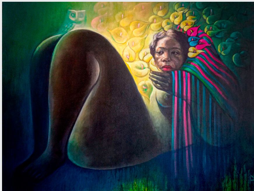
EUSEVIO ASARIAS LEANDRO HUAITÁN PACHAMAMA Acrílico sobre lienzo 110 x 118 cm