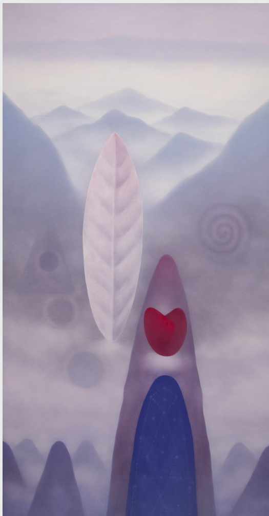
DANIEL MANTA ÁNGELES DE LA SERIE “LA MONTAÑA AZUL” Video arte Variables