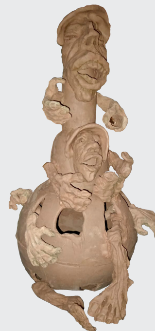
SERAFÍN LÓPEZ FABIÁN GRITO ANCESTRAL Cerámica con moldes / modelado grotesco 90 x 40 x 40 cm