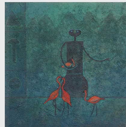
WILBERT PISCOYA S. S/T Técnica mixta / 50 x 50 cm