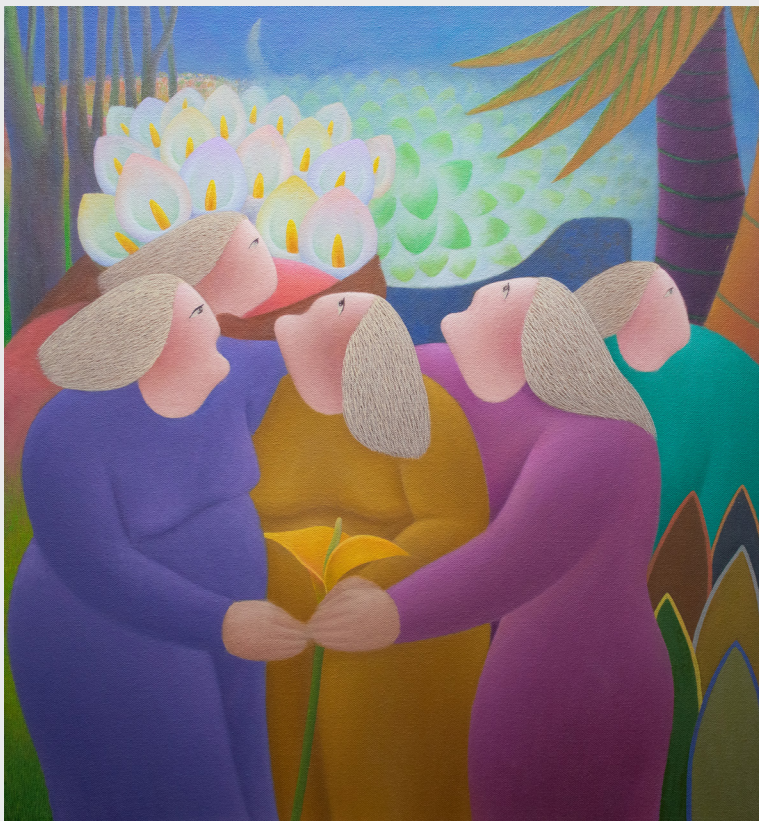
ANTONIO CARO S/T Óleo sobre lienzo 110 x 100 cm