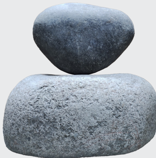
PABLO YACTAYO ORÍGENES DEL BATÁN Granito natural 43 x 38 x 21 cm