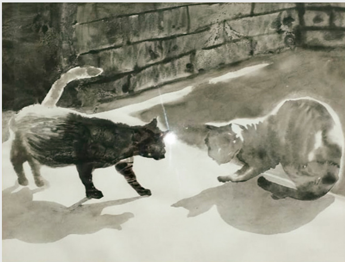
SILVIA BUENO ROLLER