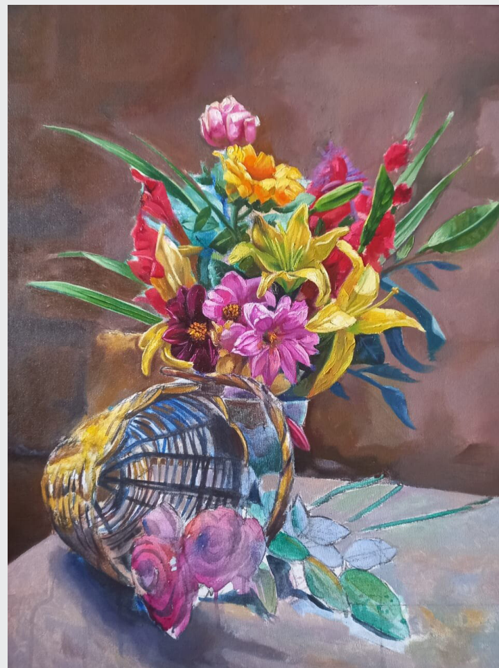
JORGE MOLINA SAIRITUPA ROSAS Y FLORES PARA MAMÁ Óleo sobre lienzo 100 x 70 cm