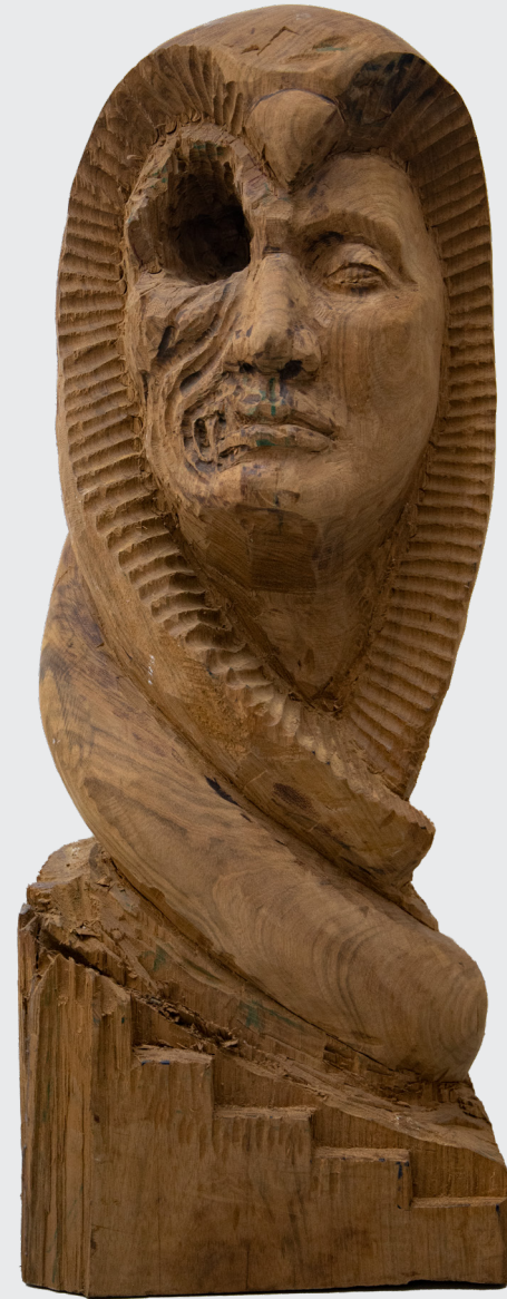
KAROLAIN FARFÁN PÉREZ GUERRERO MOCHE Talla en madera 76 x 30 x 30 cm