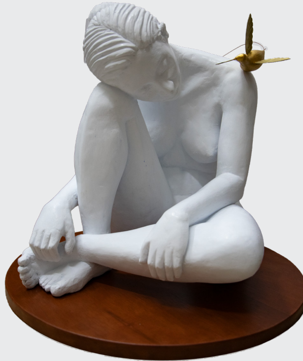
JOAQUIN RODRIGUEZ FLORES PERDIDA Vaciado en yeso 35 x 45 x 45 cm