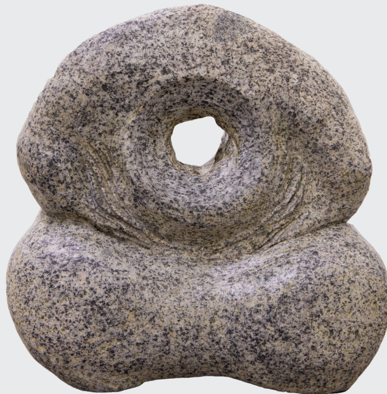
FERNANDO CRISTOBAL MARQUEZ EL VACÍO Labrado en piedra 37 x 37 x 15 cm