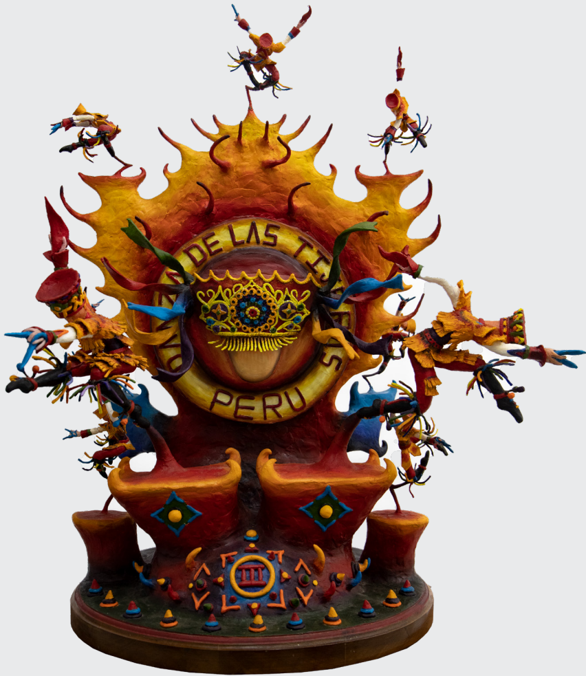
TITO MANRIQUE CHUQUILLANQUI DANZA DE LAS TIJERAS Vaciado en resina 80 x 60 x 60 cm