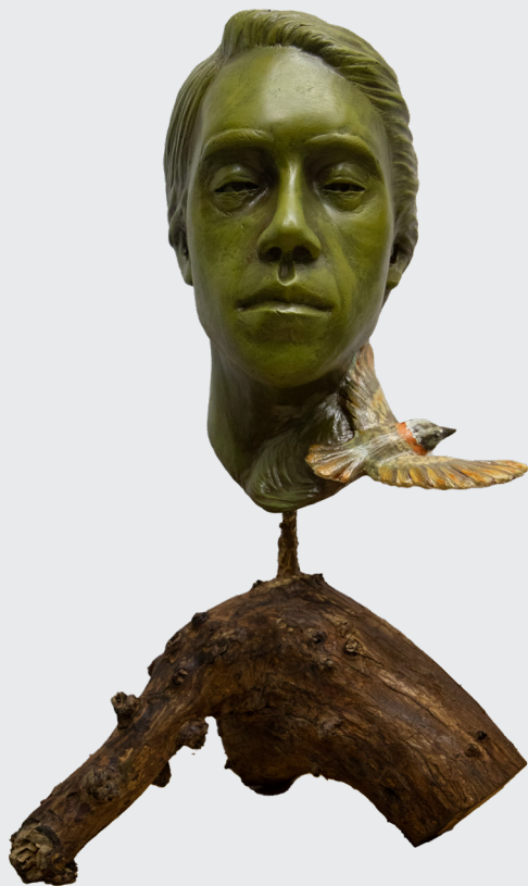
DIEGO HIDALGO TABRAJ MADRE TIERRA

Vaciado en resina sobre base de madera 60 x 38 x 24 cm