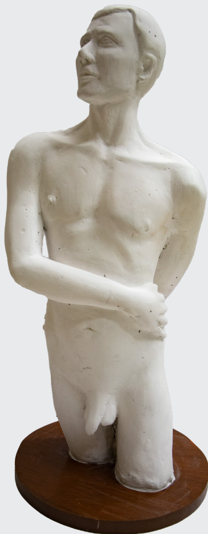
JHON PURIZACA AYALA MODELADO DE FIGURA HUMANA Vaciado en yeso 54 x 27 x 16 cm