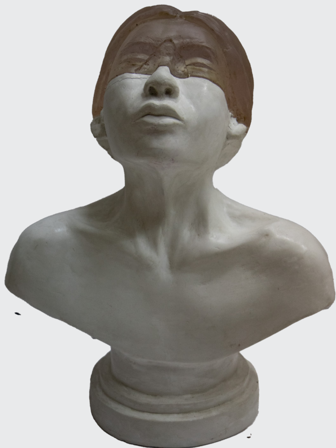
CAROL ZEGARRA RODRÍGUEZ RECONOCIMIENTO Vaciado en resina y yeso 42 x 32 x 24 cm