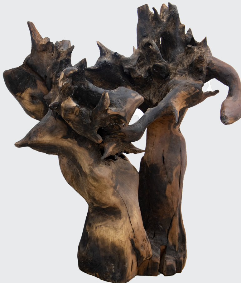
GUILLERMO JENNER MENADIO TITO SE PUEDE RENACER, SOLO TRAS LA DESTRUCCIÓN Shou Sugi Ban 102 x 70 x 90 cm