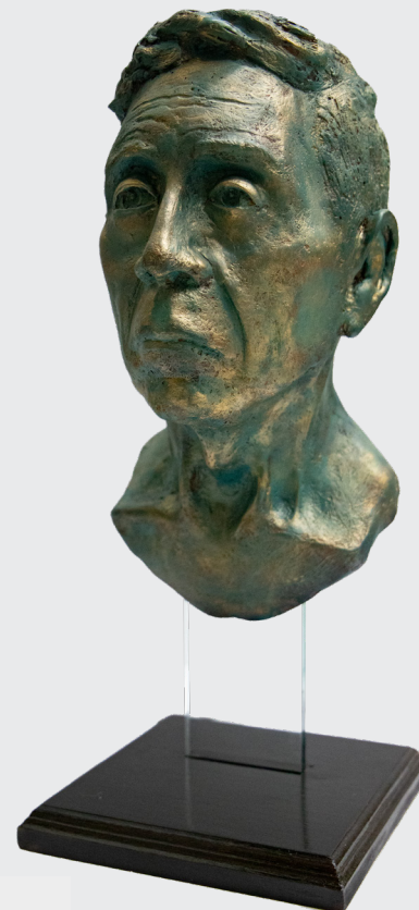
PIERO VERA FLORES ESTUDIO DE CABEZA

Vaciado en resina poliéster y fibra de vidrio 36 x 22,5 x 11,5 cm