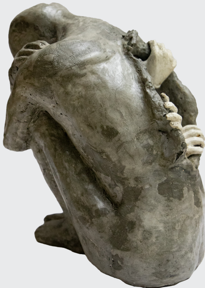
SACHIKO CALERO NUÑEZ PARA SUPERARSE Vaciado en cemento 36 x 19 x 27