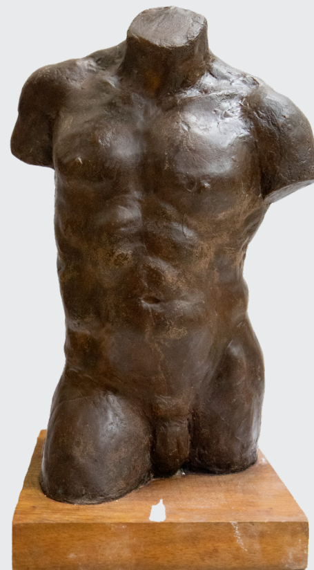
DARIANA GONZALES BLAS TORSO MASCULINO Resina con aserrín 25 x 22 x 45 cm