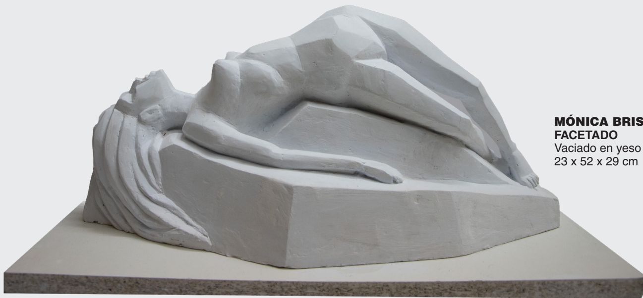
MÓNICA BRISA CAMPOS ZAPATA FACETADO Vaciado en yeso 23 x 52 x 29 cm