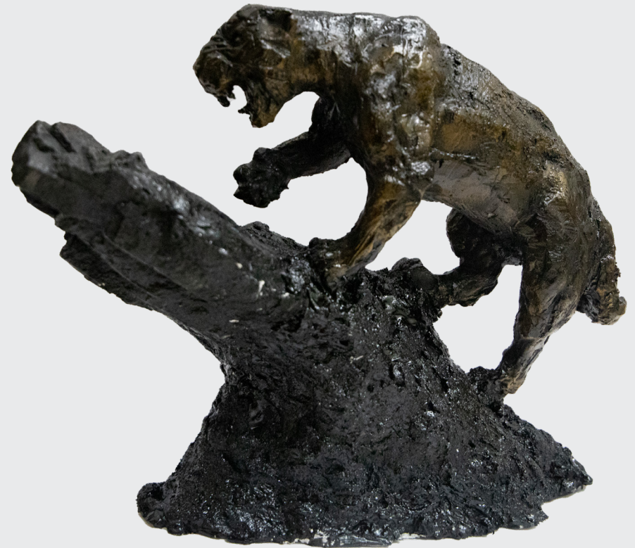
SEBASTIAN PAJUELO VILCHEZ SOMBRA EN LA CIMA Vaciado en yeso 40 x 20 x 30 cm