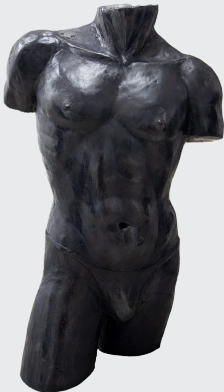
ZADITH NICOLE MUÑOZ MAITA TORSO Resina 86 x 52 x 35 cm