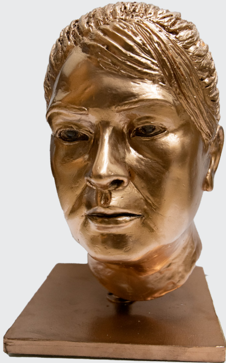
CRISTINA CCONOJHUILLCA TAPIA S/T Fibra de vidrio 40 x 25 x 25 cm