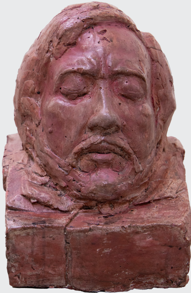
STEVE MEYHUAY RODRÍGUEZ RETRATO FÚNEBRE Cemento 35 x 35 x 35 cm