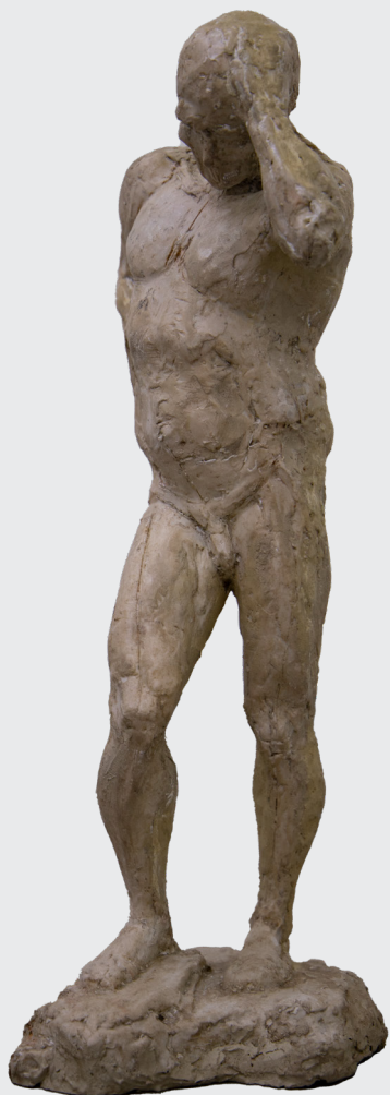
CHRISTOPHER IZQUIERDO FLORES CUNULUS Vaciado en resina 45 x 25 x 25 cm