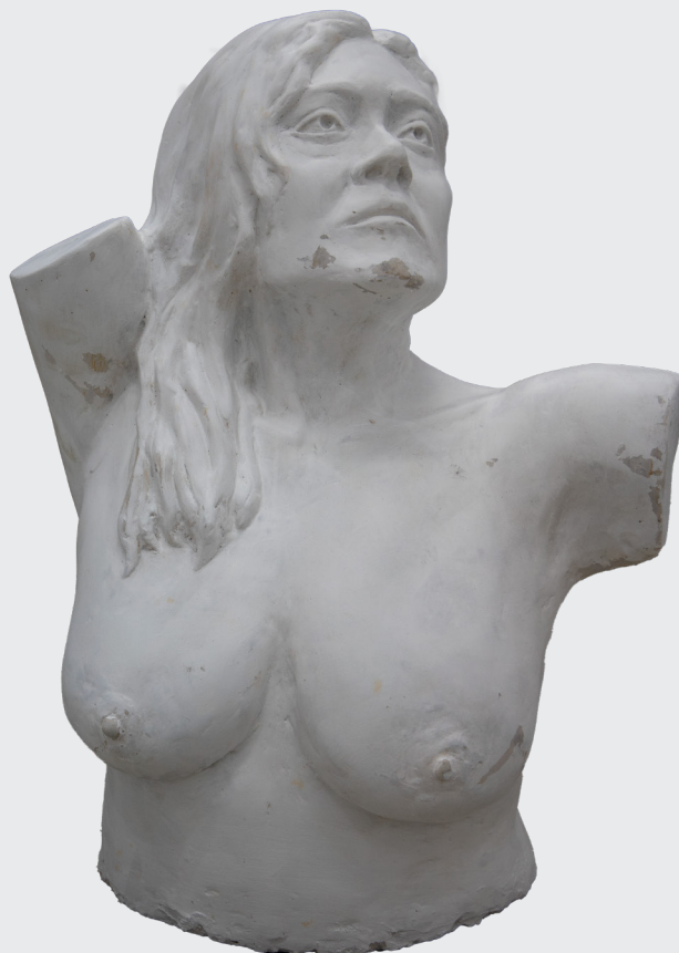
APOLO LAURA CUSTODIO ESTUDIO DE TORSO FEMENINO