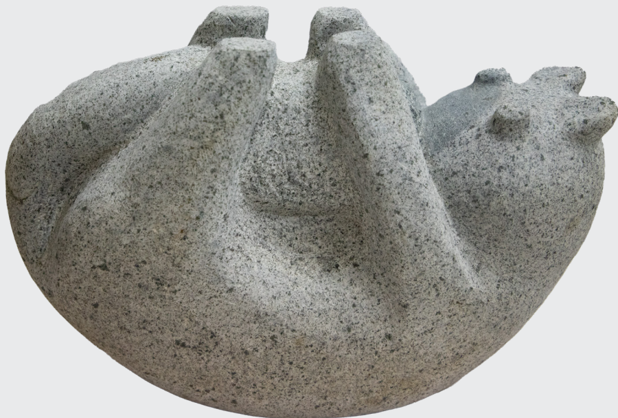
SONIA GOMEZ PONCE MIAU 01 Labrado en piedra 16,5 x 20 x 39 cm