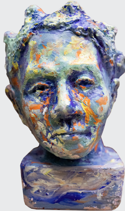
NICOLY RODRIGUEZ ALVARADO PRINCIPE NOSTÁLGICO Vaciado en yeso 24 x 21 x 15 cm