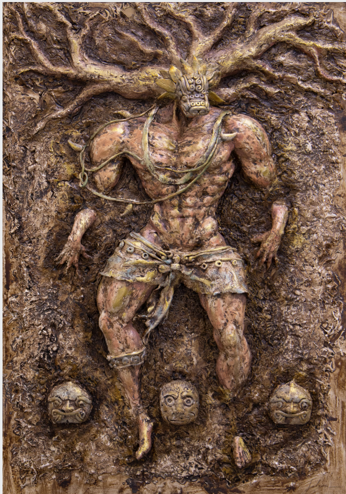
MARITZA CCENCHO FALCON EFIGIE CHAVÍN Mixta 70 x 50 x 50 cm