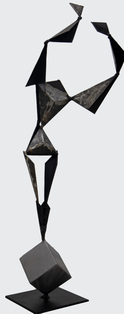
FERNANDO ORÉ CCOYLLAR DE LA SERIE “LIBERACIÓN FORJADA” Soldadura metal y forjado 123 x 46 x 37 cm